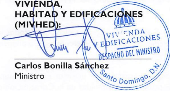
Carlos Bonilla Sánchez Ministro

POR EL MINISTERIO DE LA VIVIENDA, HABITAD Y EDIFICACIONES (MIVHED):